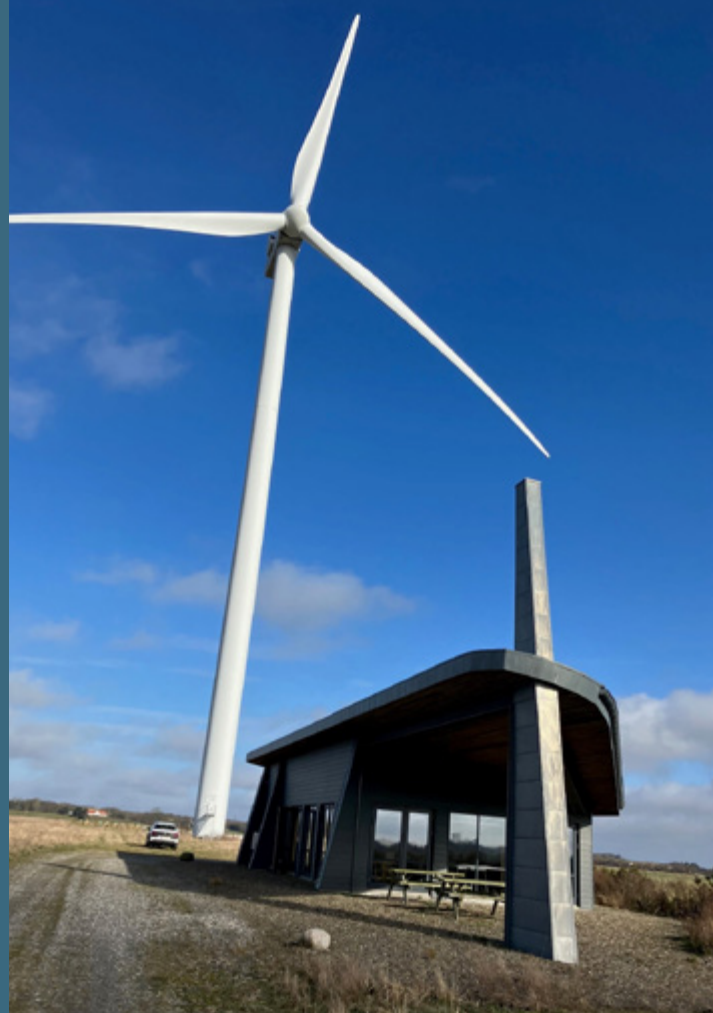
Vindmøllehuset nær Saltum

Fastholde, udvikle og tiltrække kvalificeret arbejdskraft til Nordjylland.