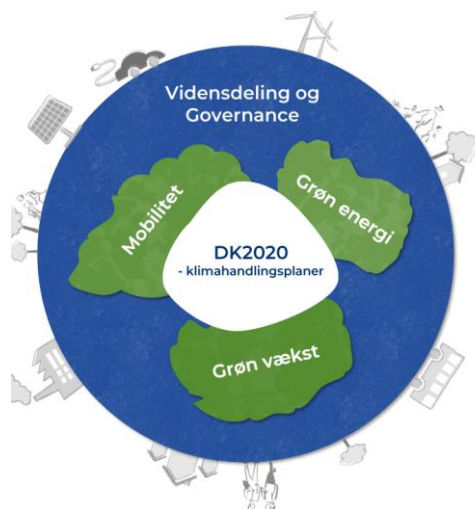
Figur 1: Figur fra Den Fælles Nordjyske Klimaambition. Samarbejdsaftalen adresserer primært de strategiske fokusområder omkring 'Vidensdeling og Governance' og 'Grøn vækst'.

Det er ligeledes hensigten, at aftalen skal styrke det erhvervsserviceflow, som er besluttet med Erhvervsfremmereformen, og at flowet bliver tydeligt for flere aktører, således at indsatser og ressourcer kan koordineres og drage nytte af hinanden, og hvor Erhvervshuset Nordjyllands status som knudepunkt tydeliggøres i forhold til den grønne omstilling. Der er brug for et stærkt og synligt knudepunkt for at kunne understøtte Den Fælles Nordjyske Klimaambition om øget videndeling og governance.